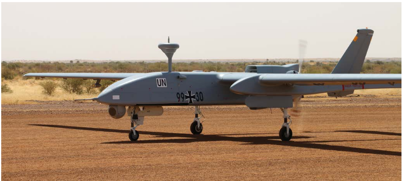
Unbemanntes Aufklärungsflugzeug Heron 1 der Bundeswehr in Gao/Mali (2016)

Der nicht-internationale bewaffnete Konflikt weist die Besonderheit auf, dass er im Wesentlichen im Gemeinsamen Artikel 3 der Genfer Konventionen und dem zweiten Zusatzprotokoll geregelt ist. Darüber hinaus finden auch die Regeln des Völkergewohnheitsrechts Anwendung, die sich sowohl auf die Situation des internationalen als auch des nicht-internationalen bewaffneten Konflikts beziehen.