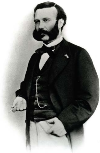
Henry Dunant (um 1864)

Noch heute bildet das humanitäre Völkerrecht eine wichtige Rechtsgrundlage für zentrale Tätigkeiten des DRK als der deutschen Rotkreuz-Gesellschaft. So obliegen dem zahlreiche Aufgaben mit Bezug zum humanitären Völkerrecht, und ihm kommt eine Aufgabe bei der Umsetzung und Weiterentwicklung des humanitären Völkerrechts zu.