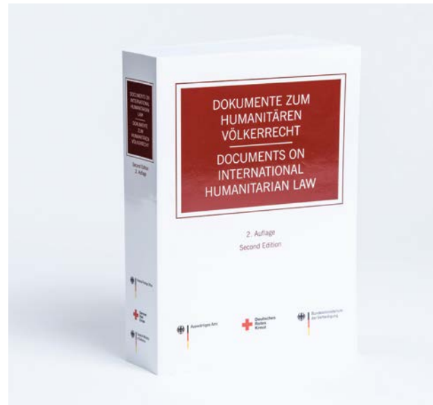
Textsammlung „Dokumente zum humanitären Völkerrecht“, gemeinsame Publikation des Auswärtigen Amtes, des DRK und des Bundesministeriums der Verteidigung (2016)

Es ist auch Teil des Mandats des DRK (Art. 3 Statuten der Internationalen Rotkreuz- und Rothalbmond-Bewegung) und des Internationalen Komitees vom Roten Kreuz (IKRK) (Art. 5 Statuten der Internationalen Rotkreuz- und Rothalbmond-Bewegung), auf die Beachtung des humanitären Völkerrechts hinzuwirken. Hier bemüht sich die internationale Gemeinschaft, mit Unterstützung der Internationalen Rotkreuz- und Rothalbmond-Bewegung, zusätzliche Mechanismen und Verfahren zu vereinbaren. In diesem Zusammenhang wurde z. B. über eine regelmäßig stattfindende Staatenkonferenz oder ein für alle Vertragsstaaten verpflichtendes Berichtssystem diskutiert.