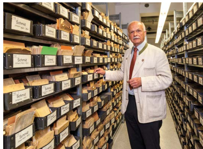
In den Regalen des Suchdienstes München sind ca. 50 Millionen Karteikarten von Vermissten und Suchenden (2013)