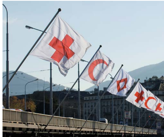
Flaggen an der Mont-Blanc-Brücke in Genf anlässlich der 30. Internationalen Konferenz des Roten Kreuzes und des Roten Halbmonds (2007)