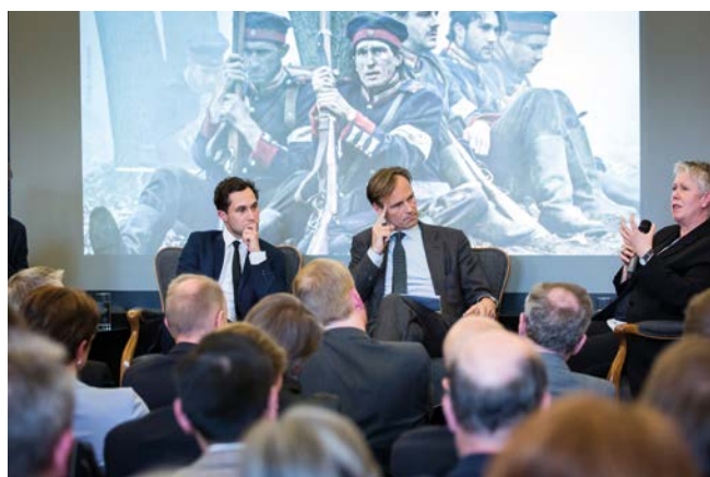
Filmabend mit Podiumsdiskussion zum humanitären Völkerrecht (2019)