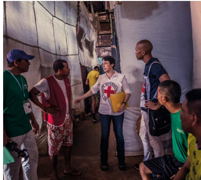
IKRK-Mitarbeitende und Mitglieder der Hygienebrigade kontrollieren die Lebensbedingungen von Inhaftierten in Panama-Stadt (2017)

Auch Vorschriften über zulässige Kampfmittel und Kampfmethoden (insbesondere Art. 35 – 42 ZP I) zielen darauf ab, die Verursachung überflüssiger Verletzungen, unnötigen Leidens sowie einer unterschiedslosen Schädigung von militärischen Zielen und Zivilpersonen oder zivilen Objekten zu verhindern. Ebenso unzulässig sind Angriffe, die unterschiedslos wirken, d. h. solche, die z. B. nicht zwischen militärischen Zielen und zivilen Personen und Objekten differenzieren (Art. 48 und 51 Abs. 4 ZP I).