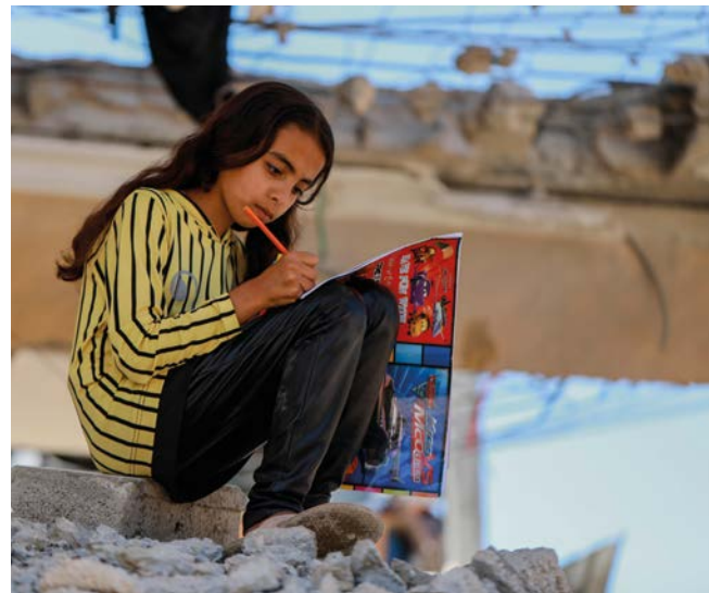
Wie auch viele andere Bewohner des Gazastreifens musste dieses Mädchen zahlreiche traumatische Kriegserlebnisse durchmachen (2021)