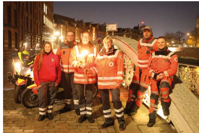
Fackellauf von Berlin nach Solferino, wo die Fackel an der Lichterprozession teilnimmt, mit der jedes Jahr der Ursprungsidee des Roten Kreuzes gedacht wird (Fackelübergabe in Hamburg, 2022)