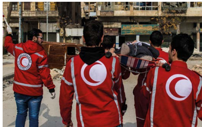
Abtransport einer hilfsbedürftigen Person durch Helfer des Syrischen Arabischen Halbmonds in Aleppo (2016) SARC