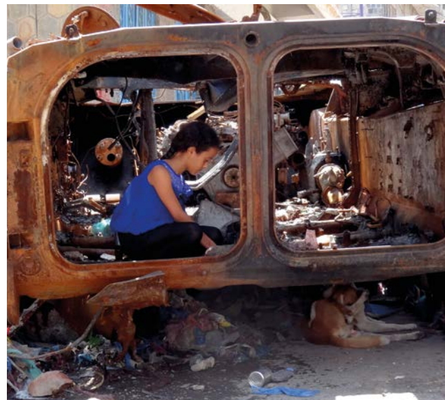
Yemen (2015)