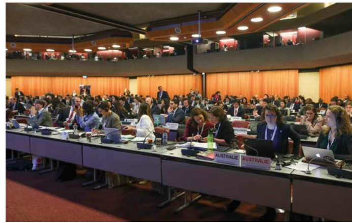
33. Internationale Konferenz der Rotkreuz- und Rothalbmond-Bewegung in Genf (2019)

Ein wichtiger Bestandteil zur Fortentwicklung ist die Teilnahme und das Mitwirken an der Internationalen Rotkreuz- und Rothalbmond-Konferenz . Die Internationale Konferenz ist das oberste beschließende Organ der Internationalen Rotkreuz- und Rothalbmond-Bewegung. In ihr prüfen die Vertretenden der Komponenten der Bewegung und die Beauftragten der Vertragsstaaten der Genfer Abkommen humanitäre Fragen von gemeinsamem Interesse sowie jede weitere damit zusammenhängende Frage und fassen dazu Beschlüsse. Das DRK trägt sowohl durch die Kommentierung zahlreicher Dokumente im Vorfeld der Konferenz als auch durch verschiedene Eingaben der jeweiligen Delegation vor Ort sowie die Mitarbeit seiner Delegationsmitglieder im Redaktionskomitee der Internationalen Konferenz regelmäßig maßgeblich zur Formulierung der Abschlussdokumente bei. Auch bei anderen Gremientreffen, wie z. B. dem Delegiertenrat der Internationalen Rotkreuz- und Rothalbmond-Bewegung, bringt sich das DRK regelmäßig zur Positionierung der Bewegung ein. Ein Schwerpunkt ist die Stärkung des humanitären Völkerrechts durch die Entwicklung von Mechanismen zur besseren Um- und Durchsetzung des humanitären Völkerrechts.