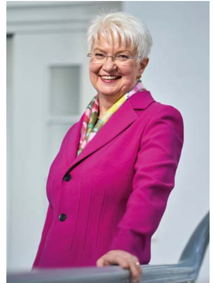
DRK-Präsidentin Gerda Hasselfeldt

In ihrer täglichen Arbeit haben mandatstragende Personen verschiedene Berührungspunkte mit dem humanitären Völkerrecht. Entscheidet sich die Bundesrepublik Deutschland beispielsweise dazu, einen (humanitär-)völkerrechtlichen Vertrag zu unterzeichnen, sind Abgeordnete des Deutschen Bundestages an dem für die Ratifikation erforderlichen Zustimmungsgesetz beteiligt. Auch kann die auf eine Ratifikation folgende Pflicht zur Umsetzung des Vertrages eine weitere nationale Gesetzgebung im formellen bzw. materiellen Sinn oder die Positionie-