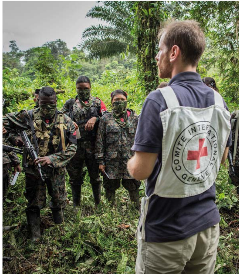
Ein IKRK-Mitarbeiter spricht in Kolumbien mit Mitgliedern der bewaffneten Gruppe ELN über die Grundsätze der internationalen Menschenrechte (2014)

Beide Rechtsregime existieren nebeneinander . Sofern es zu einem Normenkonflikt zwischen den beiden Rechtsregimen kommt, geht das humanitäre Völkerrecht im bewaffneten Konflikt als spezielleres Recht ( lex specialis ) vor. Es ist aber im Licht der allgemeinen menschenrechtlichen Verbürgungen zu interpretieren.