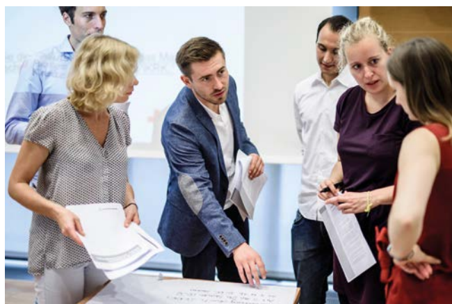
22. DRK-Sommerschule im Humanitären Völkerrecht für Jurastudentinnen und -studenten sowie Juristinnen und Juristen in Berlin (2016)