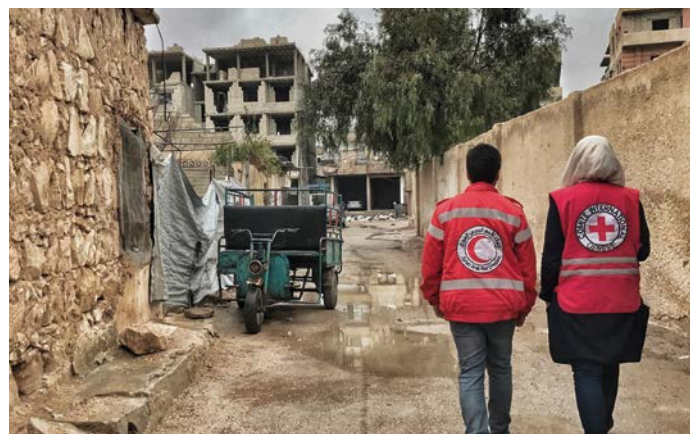
Damaskus (2018)