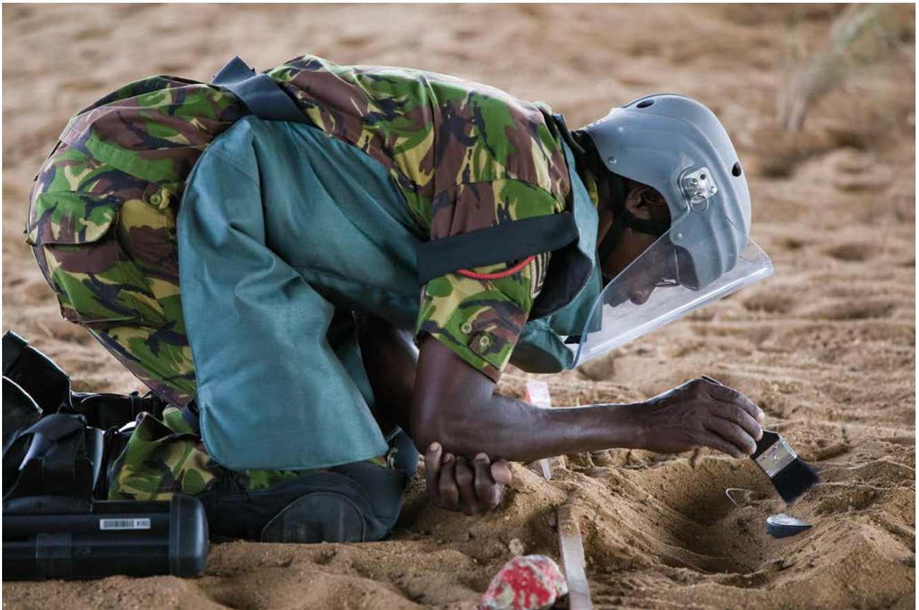
Übung einer Bombenentschärfung in Kenia (2007)