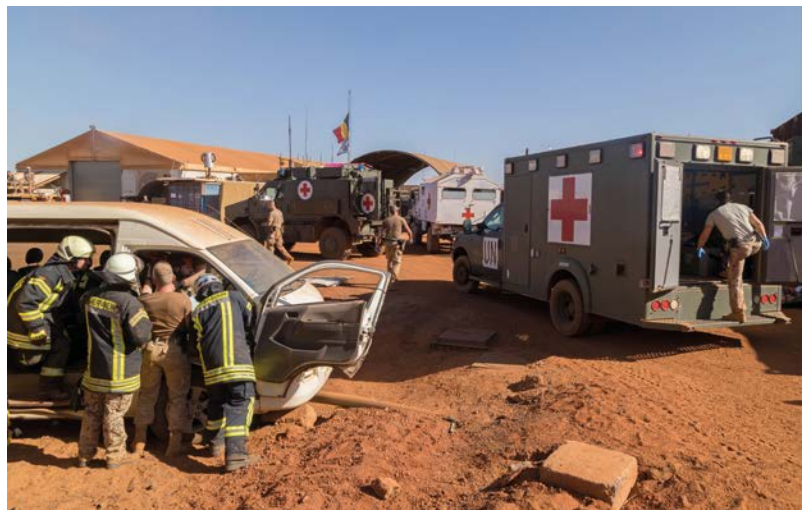
Multinationale Rettungsübung im Rahmen des MINUSMA-Einsatzes in Gao/Mali (2018)

Teilweise finden Friedensoperationen in Situationen eines bewaffneten Konflikts statt, was die Frage nach der Bindung an das humanitäre Völkerrecht in einer solchen Situation aufwirft. Obwohl die durchführenden Organisationen, wie z. B. die VN oder EU, als solche keine Vertragsparteien der Genfer Abkommen sind, wird eine Bindung dieser Agierenden und ihres im Rahmen des Einsatzes tätigen militärischen Personals an das humanitäre Völkerrecht bejaht , unter Berücksichtigung der Tatsache, dass sie als „Parteien“ am bewaffneten Konflikt teilnehmen.