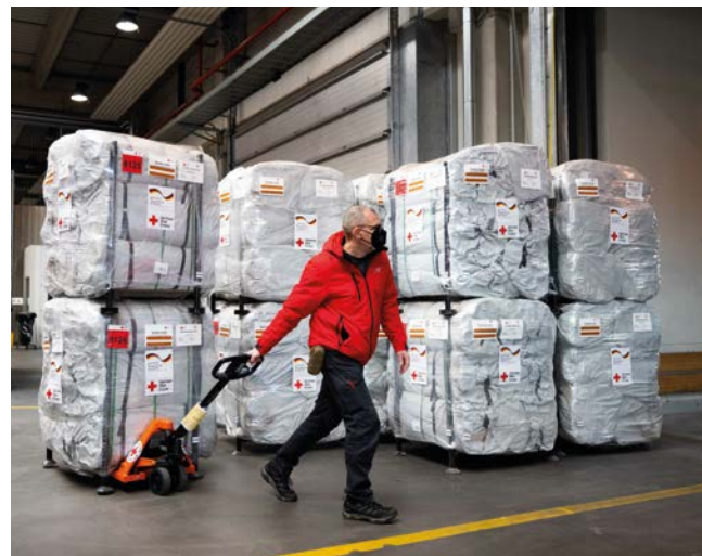
Verladung von Hilfsgütern im Logistikzentrum des DRK zur Versorgung der Bevölkerung in der Ukraine und für Flüchtlinge (2022)