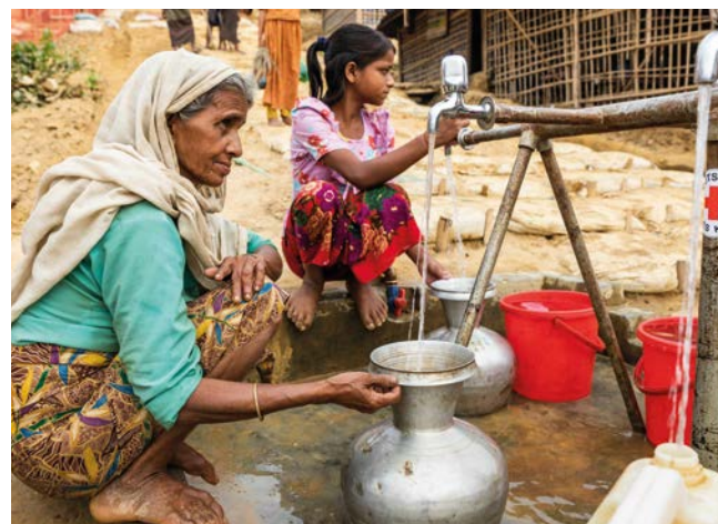
Humanitäre Hilfe des DRK für Mitglieder der Volksgruppe der Rohingya aus Myanmar in einem Flüchtlingslager in Bangladesch (2018)