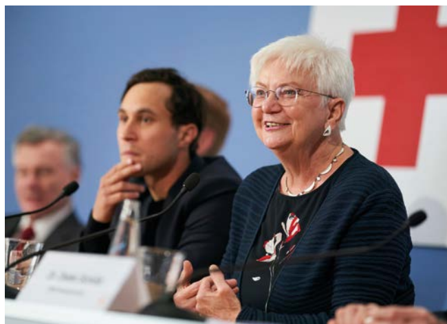
DRK-Präsidentin Gerda Hasselfeldt und DRK-Botschafter für humanitäres Völkerrecht Ludwig Trepte bei der Jahrespressekonferenz (2019)

Die Notwendigkeit der Verbreitungsarbeit innerhalb der Bundesrepublik Deutschland wird auch daran deutlich, dass nicht nur deutsche Soldatinnen und Soldaten im Rahmen verschiedener Mandate im Ausland ihren Dienst absolvieren. Aktuell sind auch der Zoll und die Bundes- und Landespolizei an 16 verschiedenen Auslandsmissionen in Konfliktgebieten beteiligt. Das humanitäre Völkerrecht ist daher nicht nur eine Angelegenheit, die die Bundespolitik beschäftigt, sondern ist auch für jeden Landkreis und jede Kommune von Bedeutung.