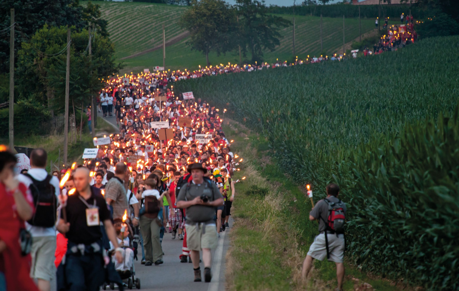
Fackelzug von Solferino nach Castiglione delle Stiviere im Andenken an die Schlacht von Solferino (23. Juni 2012)