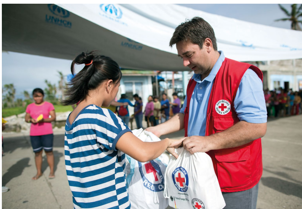
Verteilung von Hilfsgütern in Dulag, Philippinen nach dem Taifun Haiyan (Januar 2014)

Nationale Gesellschaften leisten gemäß ihres nationalen Kontextes und ihrer eigenen Ressourcen unterschiedliche Formen der Unterstützung. Diese umfassen