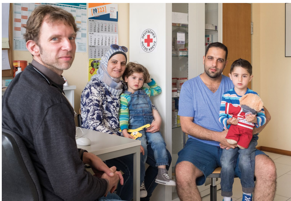
Erstaufnahme für Asylsuchende des DRK-KV Hamburg-Harburg: Geflüchtete beim Arztbesuch (Juni 2015)

Die Internationale Rotkreuz- und Rothalbmond-Bewegung setzt sich im Rahmen ihres Mandates für alle hilfebedürftigen Menschen ein und wirkt Diskriminierung entgegen. Die Liste der nach dem Grundsatz der Unparteilichkeit untersagten Unterscheidungskriterien – d. h. Nationalität, Rasse, Religion, soziale Stellung und politische Überzeugung – ist dabei nicht abschließend. Über die benannten Kriterien hinaus, die häufig Grundlage unzulässiger Diskriminierung sind, ist auch eine Unterscheidung nach sonstigen relevanten Merkmalen, beispielsweise nach Geschlecht, sexueller Orientierung oder gesellschaftlichem Status, unzulässig. 7 Die Verwendung des „Rasse-Begriffes“ wird im DRK teilweise als diskriminierend angesehen und u. a. mit Blick auf die deutsche Geschichte als unangemessen kritisiert. Daher macht das DRK mitunter von der Möglichkeit Gebrauch, auf die Bedenken hinsichtlich der Verwendung dieses Begriffes hinzuweisen und zu erläutern, dass dieser im DRK im Sinne von „Ethnie“ oder „ethnischer Herkunft“ verstanden wird. Eine einseitige sprachliche Veränderung des Grundsatzes durch das DRK ist nicht möglich, da dieser verbindlich durch die Internationale