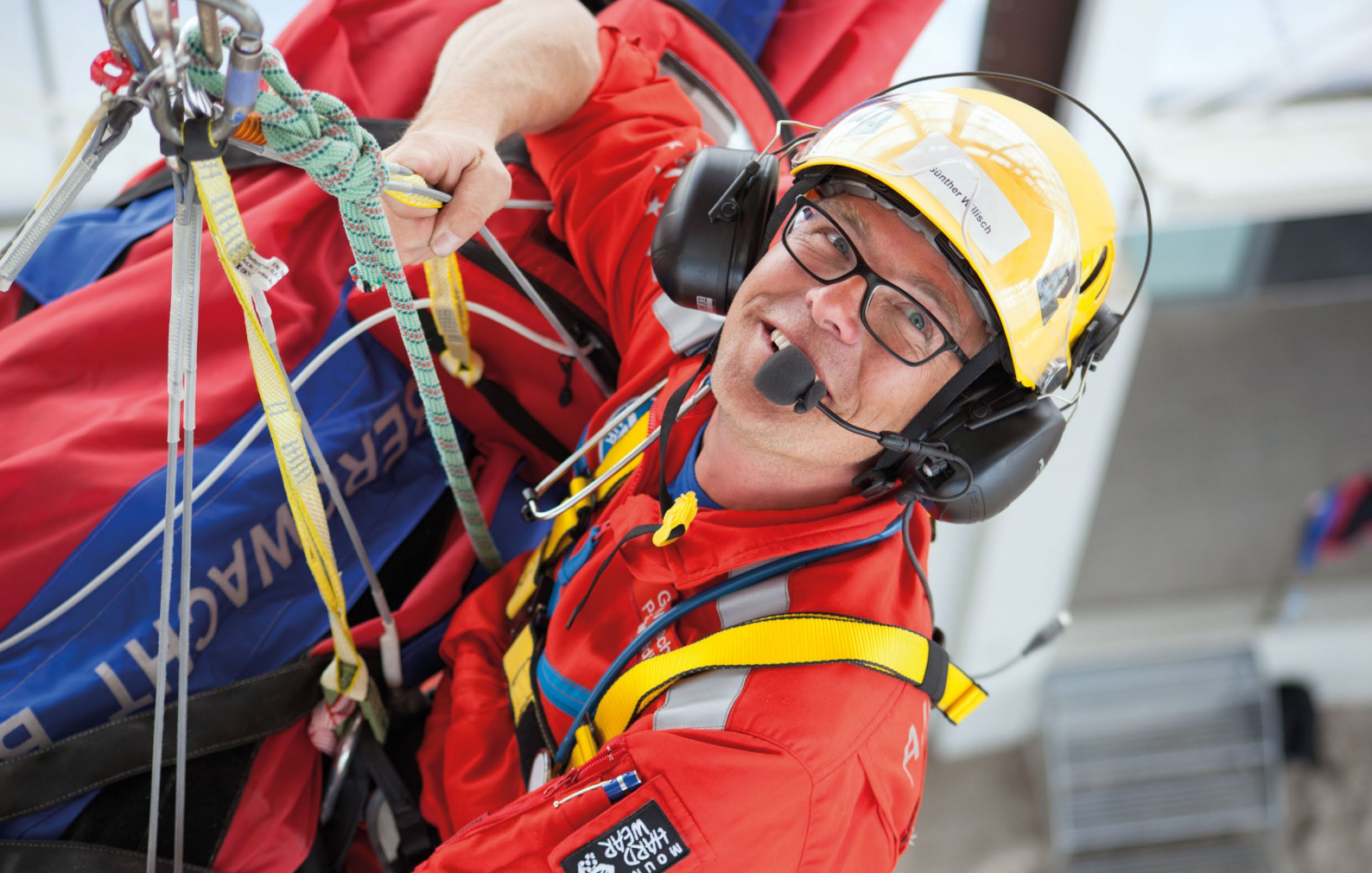
Notfallsimulationstraining der Bergwacht in Bad Tölz (April 2014)

gemeinsamen Hilfe verabredet. Ihr Einsatz war auch für das DRK sehr wertvoll. Das DRK ist daher bemüht, sich künftig besser auf ungebundene Helfende einzustellen, ihre Rolle in bestehende Krisenbewältigungsstrategien zu integrieren und weiterzuentwickeln. Auf Grundlage einer ersten Analyse wurde Lehrmaterial zur Qualifikation der Katastrophenstäbe erstellt. 29