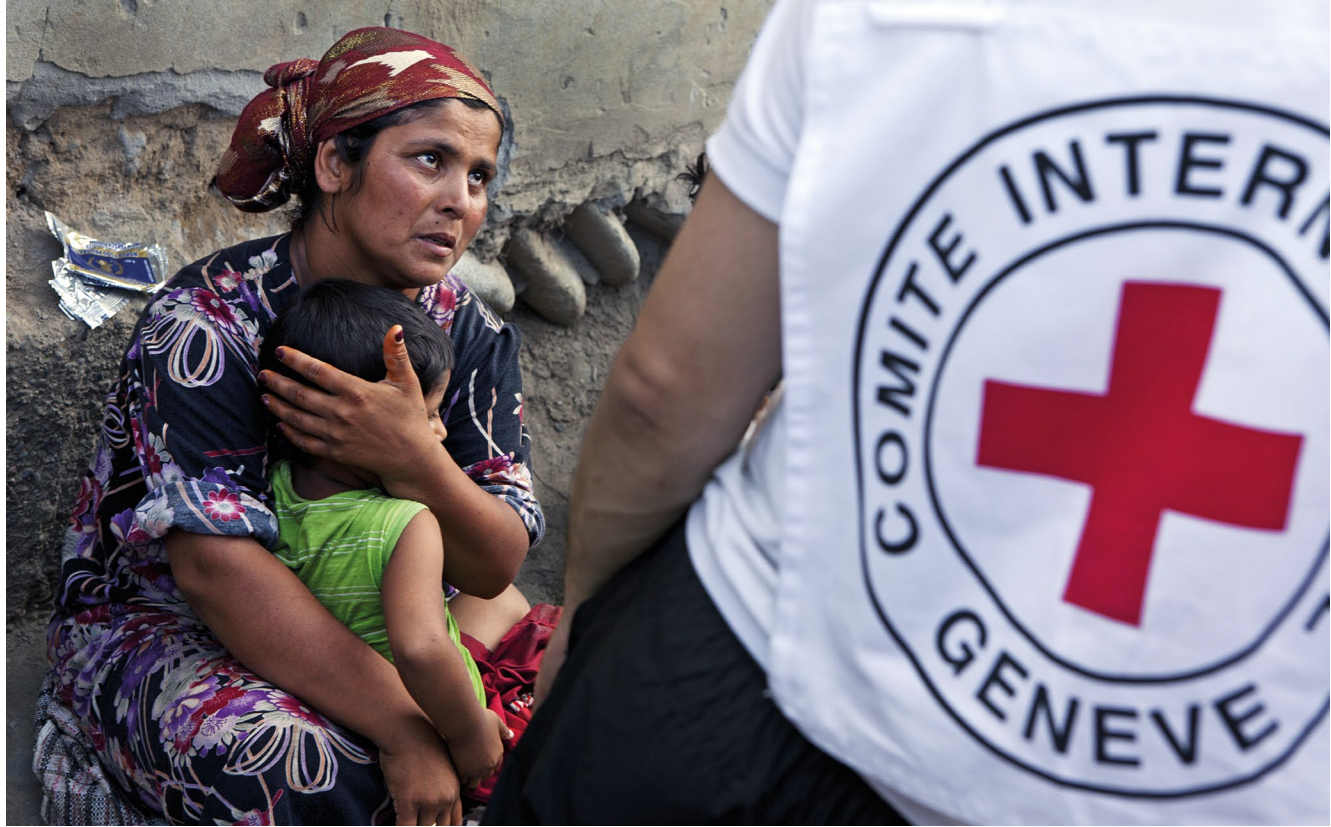
IKRK-Mitarbeiter in Kirgisistan an der Grenze zu Usbekistan (Juni 2010)