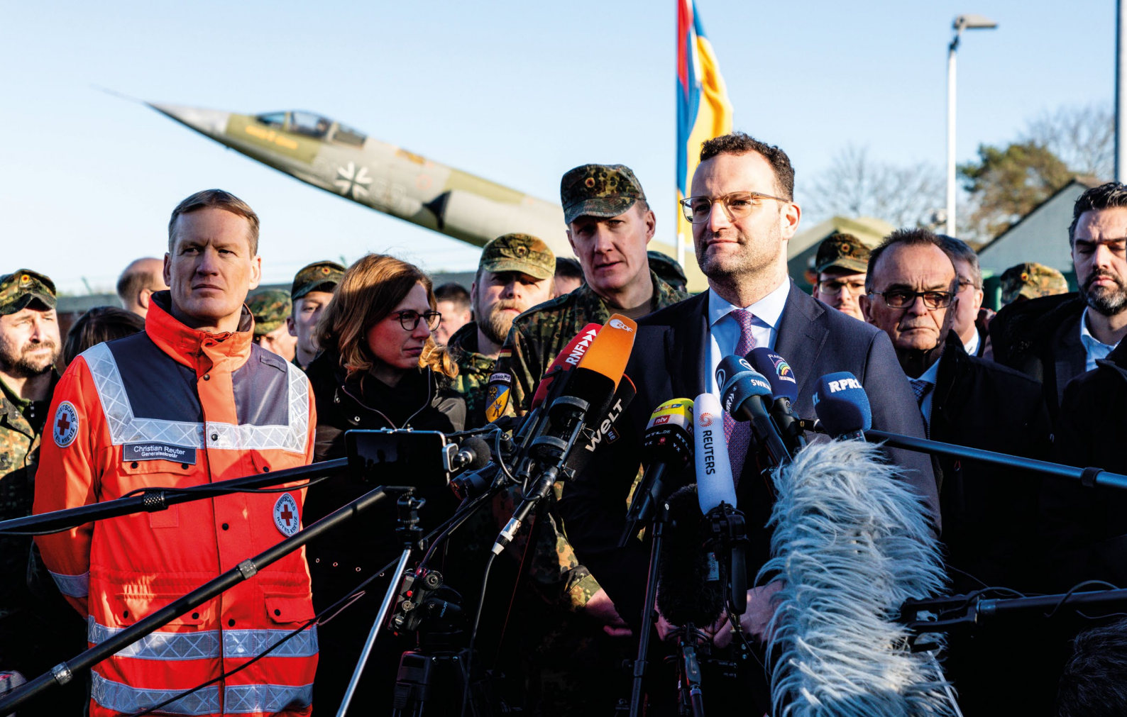
Pressekonferenz des DRK-Generalsekretärs Christian Reuter und des Bundesministers für Gesundheit Jens Spahn in der Südpfalz-Kaserne in Germersheim im Februar 2020