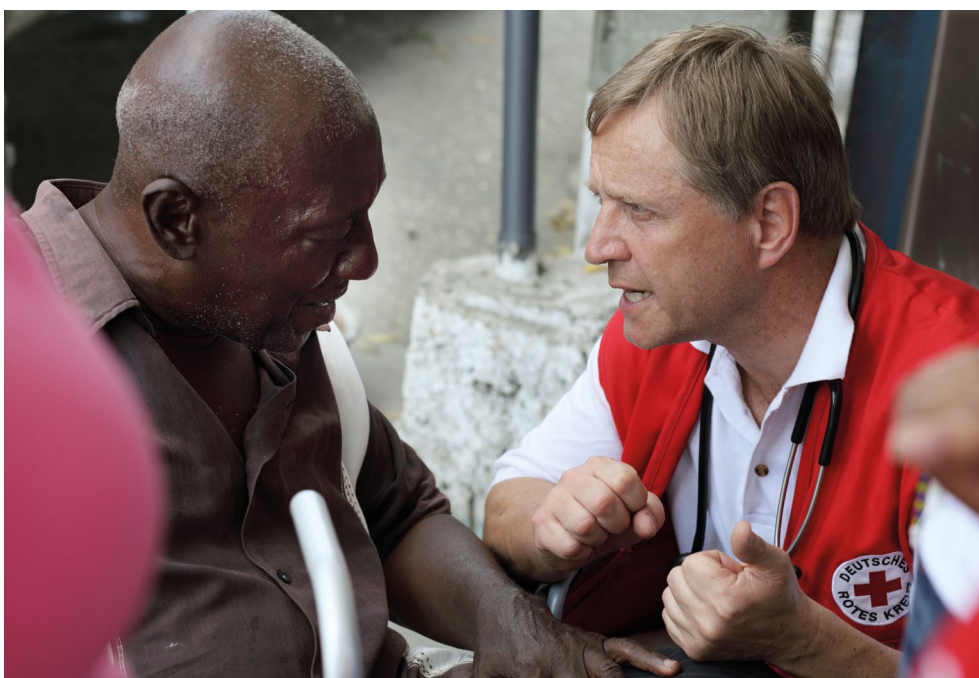
Mobiles medizinisches Team des DRK in Port-au-Prince, Haiti (Februar 2010)

Dem Schutz menschlicher Gesundheit als Teil der Mission der Internationalen Rotkreuz- und Rothalbmond-Bewegung liegt das Verständnis von Gesundheit als ein Zustand des vollständigen körperlichen, geistigen