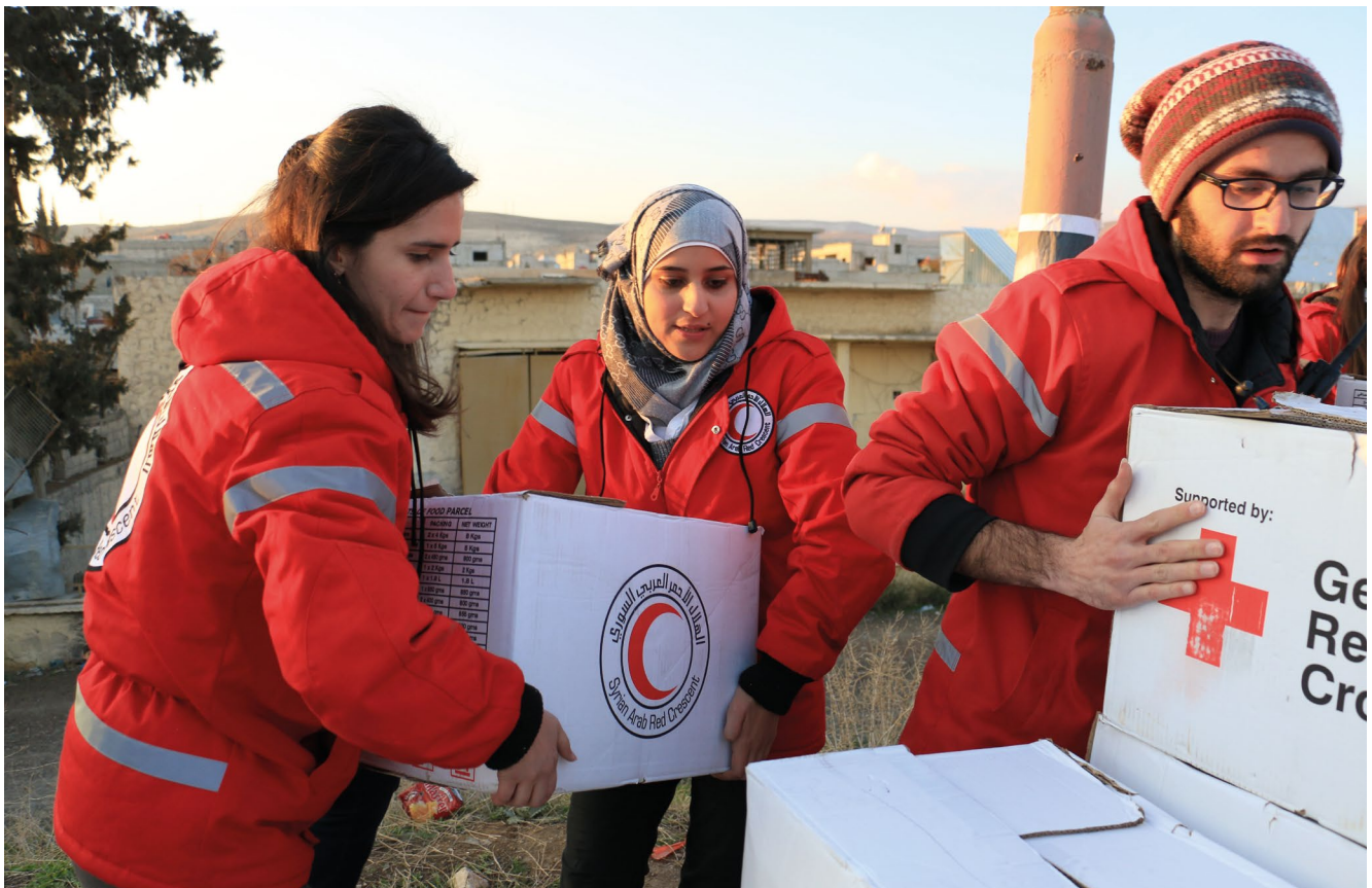
Freiwillige des Syrisch Arabischen Roten Halbmondes bei der Vorbereitung der Verteilung von Lebensmitteln bei Damaskus (2014)

liche religiöse oder kulturelle Haltungen der Mitglieder nicht – den Grundsatz der Neutralität missverstehend – tabuisiert werden. Nicht zuletzt der Grundsatz der Menschlichkeit gebietet gegenseitiges Kennenlernen, Achtung und Toleranz. Dementsprechend steht auch das DRK allen Menschen als Mitgestaltende offen. Dieses „Selbstverständnis“ findet in §1 Abs. 1 Satz 2 der DRK-Bundesatzung bzw. der Mustersatzung für DRK-Ortsvereine Ausdruck.