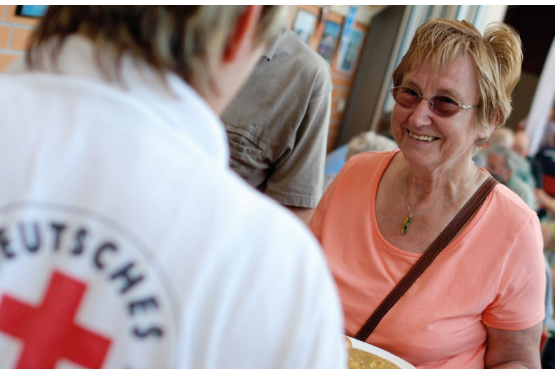
Essensausgabe in einer Sporthalle während des Elbe-Hochwassers (Juni 2013)

Eine weitere Ausprägung des Grundsatzes der Einheit ist das deutschlandweite, interdisziplinäre Zusammenarbeiten im DRK. Zu nennen ist hier insbesondere das sog. „Komplexe Hilfeleistungssystem“ (KHS). Hierbei handelt es sich um ein strategisches Konzept, das von DRK-Präsidium und DRK-Präsidialrat 2005/2006 verbindlich verabschiedet wurde. Kerngedanke ist, die vielseitigen Aufgabenfelder des DRK so miteinander zu verbinden, dass sie für die Bewältigung von Katastrophen aller Art unter einer einheitlichen Führungssystematik nutzbar sind. So kann zum einen den neuen Herausforderungen in der zivilen Sicherheitsvorsorge und der heute deutlich komplexeren Ereignisbewältigung begegnet werden. Dies gilt insbesondere auch vor dem Hintergrund des demografischen Wandels, d. h. mehr alte Menschen, die mehr Unterstützung benötigen, bei weniger einsatzbereiten Kräften. Zum anderen kann das DRK so statt einer nur punktuellen Hilfsstruktur bei Schadenslagen darüber hinaus auch eine dauerhafte Struktur mit umfassenden sozialen und gesundheitsbezogenen Angeboten, die vor und nach der Schadenslage greifen, bieten. Konkret bedeutet dies, dass beispielsweise bei Großschadenslagen nicht nur die Gemeinschaften der Bereitschaften, Berg- und Wasserwacht angesprochen sind, sondern auch das Jugendrotkreuz sowie die Wohlfahrts- und Sozialarbeit und zwar sowohl mit ihrer ehrenamtlichen Gemeinschaft als auch mit ihren über-