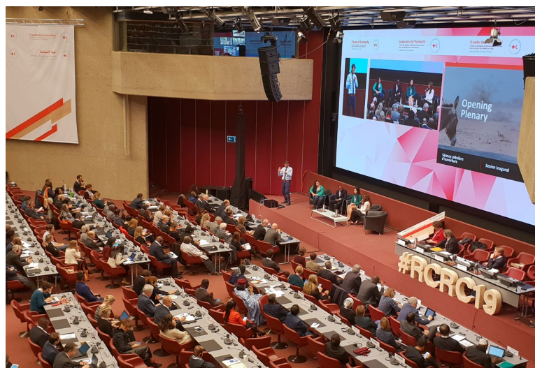
33. Internationale Konferenz des Roten Kreuzes und Roten Halbmondes (Genf 2019)

eigene Programme für das Gemeinwohl, wie etwa in den Bereichen Erziehung, Gesundheit und soziale Wohlfahrt (Art. 3 Abs. 2 Statuten der Bewegung). In Deutschland ist das DRK dementsprechend auch ein anerkannter Spitzenverband der Freien Wohlfahrtspflege und nimmt die Interessen derjenigen wahr, die der Hilfe und Unterstützung bedürfen, um soziale Benachteiligung, Not und menschenunwürdige Situationen zu beseitigen sowie auf die Verbesserung der individuellen, familiären und sozialen Lebensbedingungen hinzuwirken (§ 1 Abs. 4 DRK-Satzung). Im internationalen Bereich ist es Aufgabe der Nationalen Gesellschaften, insbesondere den Opfern von bewaffneten Konflikten, Naturkatastrophen und anderen Notlagen Beistand zu leisten (Art. 3 Abs. 3 Statuten der Bewegung). In Übereinstimmung mit § 2 DRKG nimmt das DRK zudem Aufgaben wahr, die sich für eine Nationale Gesellschaft aus den Genfer Abkommen und ihren Zusatzprotokollen ergeben. Zu diesen Aufgaben zählen somit insbesondere die Unterstützung des Sanitätsdienstes der Bundeswehr im Sinne des Art. 26 des I. Genfer Abkommens, die Verbreitung von Kenntnissen über das humanitäre Völkerrecht sowie die Grundsätze und Ideale der Bewegung, die Wahrnehmung der Aufgaben eines amtlichen Auskunftsbüros nach Art. 122