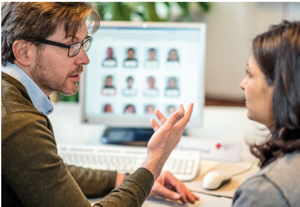
Beratung des DRK-Suchdienstes am Standort Hamburg (2015)

Vertragsstaaten der Genfer Abkommen und die Komponenten der Rotkreuz- und Rothalbmond-Bewegung haben ihr gegenseitiges Verhältnis in einer im Jahr 2007 von der Internationalen Konferenz verabschiedeten Resolution als eine spezifische und eigene Partnerschaft („specific and distinctive partnership“) definiert. 18 Diese Partnerschaft ist durch gegenseitige Verantwortung und Unterstützung gekennzeichnet. Nationale Gesellschaften haben danach u. a. die Pflicht, Anfragen der