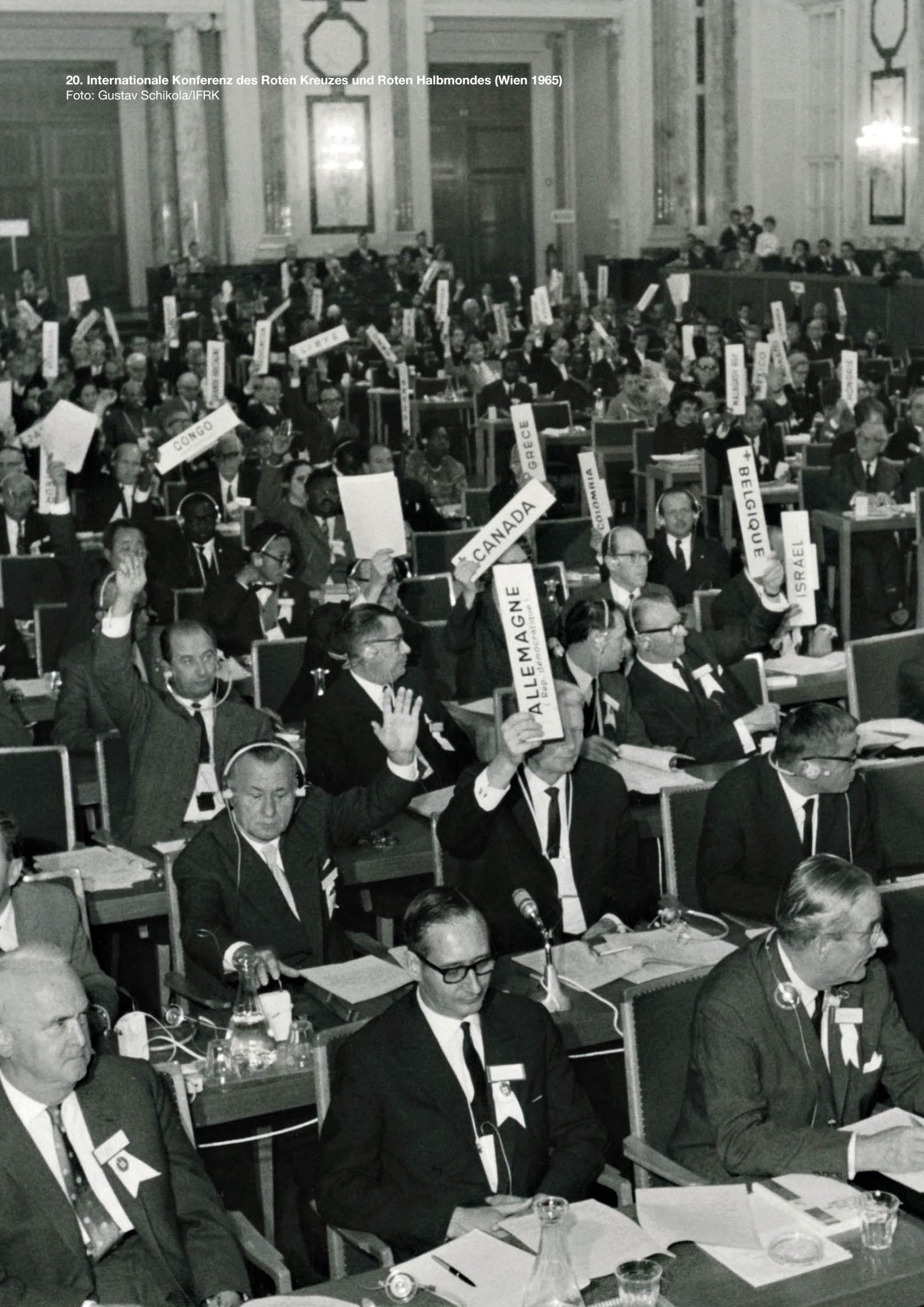
20. Internationale Konferenz des Roten Kreuzes und Roten Halbmondes (Wien 1965)