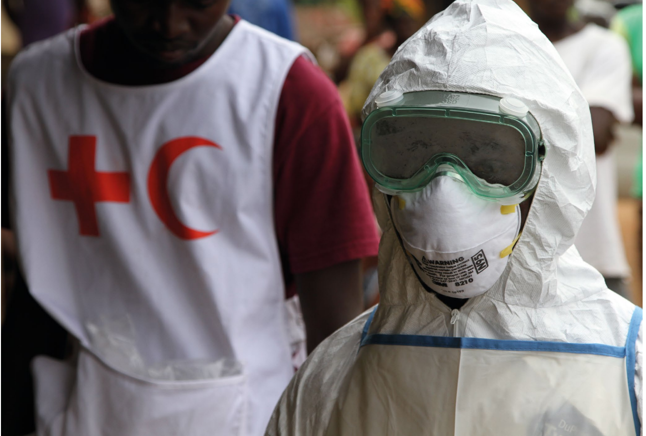
Freiwilliger des Roten Kreuzes von Sierra Leone in Schutzkleidung während des Ebola-Ausbruchs in Westafrika (Juli 2014)

und sozialen Wohlergehens zugrunde, und nicht nur das Fehlen von Krankheit oder Gebrechen. 4 Der Begriff des „Gesundheitsschutzes“ bezieht sich auf alle Maßnahmen auf globaler, regionaler, nationaler und kommunaler Ebene zur Erhaltung, Förderung und Wiederherstellung von Gesundheit. Das Mandat des DRK umfasst somit ausdrücklich nicht nur die Wiederherstellung von Gesundheit, sondern – mit gleichrangiger Bedeutung – auch ihre Erhaltung und Förderung. Die historische Präambel des Grundsatzes der Menschlichkeit erinnert zum einen an die Bedeutung, die dem Gesundheitsschutz als Aufgabengebiet der Bewegung seit ihren Anfangsjahren zukam. Zum anderen macht sie einen sich verändernden Gesundheits(schutz)begriff deutlich, der heute nicht länger auf die Versorgung von in Kampfhandlungen zugefügten Verletzungen begrenzt ist, sondern Maßnahmen bis hin zur betrieblichen Gesundheitsförderung umfasst. Als Zielgruppen von Gesundheitsschutzmaßnahmen kommen sowohl externe als auch interne Gruppen infrage. Dazu zählen Menschen in akuten Notfällen und Katastrophen im Inland; Notleidende und Bedürftige im Ausland; ältere und alte Menschen; kranke und pflegebedürftige Menschen; Kinder, Jugendliche und Familien; Menschen mit Behinderungen und Benachteiligungen sowie Mitarbeitende im Haupt- und Ehrenamt. Das DRK bietet zum Schutz der Gesundheit daher vielfältige Angebote und