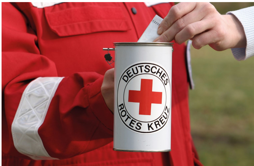
DRK-Spendendose (2010)

tastrophe mit dem Ziel einer möglichst genauen und zeitnahen Lageeinschätzung zum Einsatz. Die vom Sekretariat der Internationalen Föderation in Genf koordinierten „Response Teams“ können innerhalb von 12 bis 24 Stunden aktiviert werden. Auf Grundlage der Berichte dieser Teams werden anschließend, wo nötig und stets auf Ersuchen und nach Priorisierung der lokalen Nationalen Gesellschaft, Beiträge der Komponenten der Bewegung zu einem Hilfeinsatz angefordert und koordiniert. 8 Zum anderen ist die Bewegung bestrebt, dafür Sorge zu tragen, dass hilfebedürftige Menschen im Sinne von „Empowerment“ ihre Bedarfe selber formulieren und einbringen bzw. betroffene Gemeinschaften an Lösungsfindungen beteiligt werden. 9 Für unparteiliche Hilfe ist es unabdingbar, dass nicht nur an einen bestimmten Verwendungszweck gebundene, sondern freie Mittel zur Verfügung stehen. Während im Falle zweckgebundener Spenden oder öffentlicher Mittel selbstverständlich der Spendewille bzw. die Zweckbindung zu achten ist, kann dank freier Mittel sichergestellt werden, dass die Komponenten der Bewegung ihre Hilfe mit der erforderlichen Flexibilität allein nach Ausmaß und Dringlichkeit bestimmter Projekte ausrichten können. Auch kann so in Fällen, in denen die Mittel für bestimmte Projekte sehr ungleich verteilt sind, für einen Ausgleich gesorgt werden und können Opfer von in der allgemeinen Aufmerksamkeit weniger berücksichtigten Notlagen unterstützt werden.