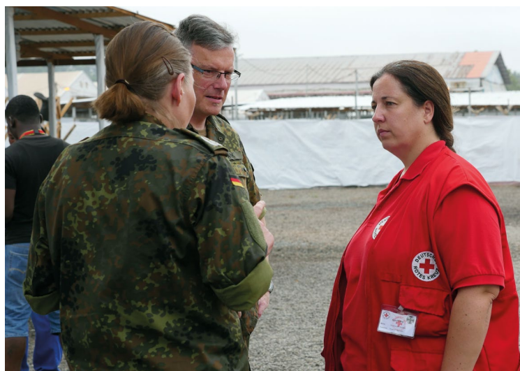
DRK-Mitarbeiterin und Angehörige der Bundeswehr in einem Ebola-Behandlungszentrum in Monrovia, Liberia (Februar 2015)

darf), entspricht eine solche Datenerhebung und -verarbeitung nicht dem Zweck des DRK-Suchdienstes. Dieser hat allein die Sammlung und Verarbeitung von Daten von Betroffenen und Suchenden zur Klärung der Unwissenheit über den Verbleib nahestehender Personen aus humanitären Gründen sowie die Wiederherstellung von Kontakt zwischen diesen Personen zum Ziel. Das DRK muss daher stets dafür Sorge tragen, dass bei seiner Beteiligung in Personenauskunftsstellen unter der Leitung einer Behörde die vom DRK erfassten Daten ausschließlich zu Suchdienst-Zwecken erhoben und verwendet werden. Auch die mögliche Nutzung gemeinsamer Räumlichkeiten, Telefonnummern oder IT-Infrastruktur kann dazu führen, dass die Unabhängigkeit des DRK in Frage gestellt wird. Das DRK-Präsidium nahm daher im April 2015 entsprechende „Leitlinien für die Zusammenarbeit des DRK mit Behörden, insbesondere der Polizei im Personenauskunftswesen nach Landesrecht“ an. Diese sehen u. a. vor, dass die Personenauskunft des DRK ausschließlich zu humanitären Zwecken erfolgen darf, die Unabhängigkeit des