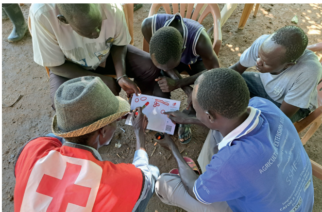
📷 Mitglieder einer Gemeinde in Madagaskar zeichnen vergangene Überschwemmungsgebiete auf einer Karte ein.

Im Rahmen von Gruppendiskussionen und Gesprächen können relevante Informationen direkt von den lokalen Akteuren (beispielsweise von Dorfbewohnerinnen und Dorfbewohnern) beigesteuert und mit Stiften auf die Papierkarten eingezeichnet werden. Diese Art der Datenerhebung ermöglicht es insbesondere Personen ohne technisches Wissen, an dem Prozess teilzuhaben und fördert so auch das Verständnis und die Akzeptanz für die im Anschluss entwickelten Aktivitäten.